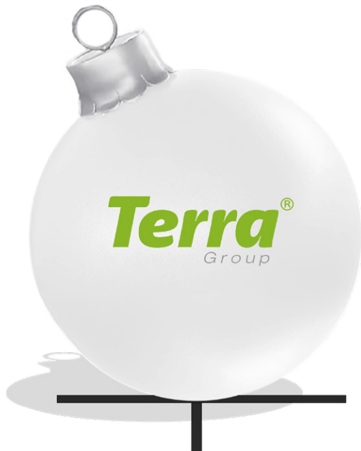
WEIHNACHTSKUGEL MIT LOGO