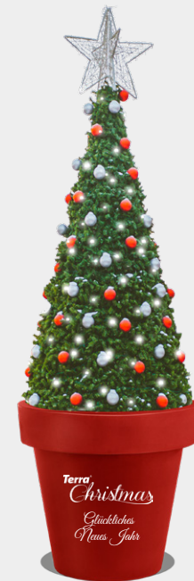
WEIHNACHTSÜBERZUG UND BLUMENTOPF GIANTO MIT LOGO UND WEIHNACHTSWÜNSCHEN