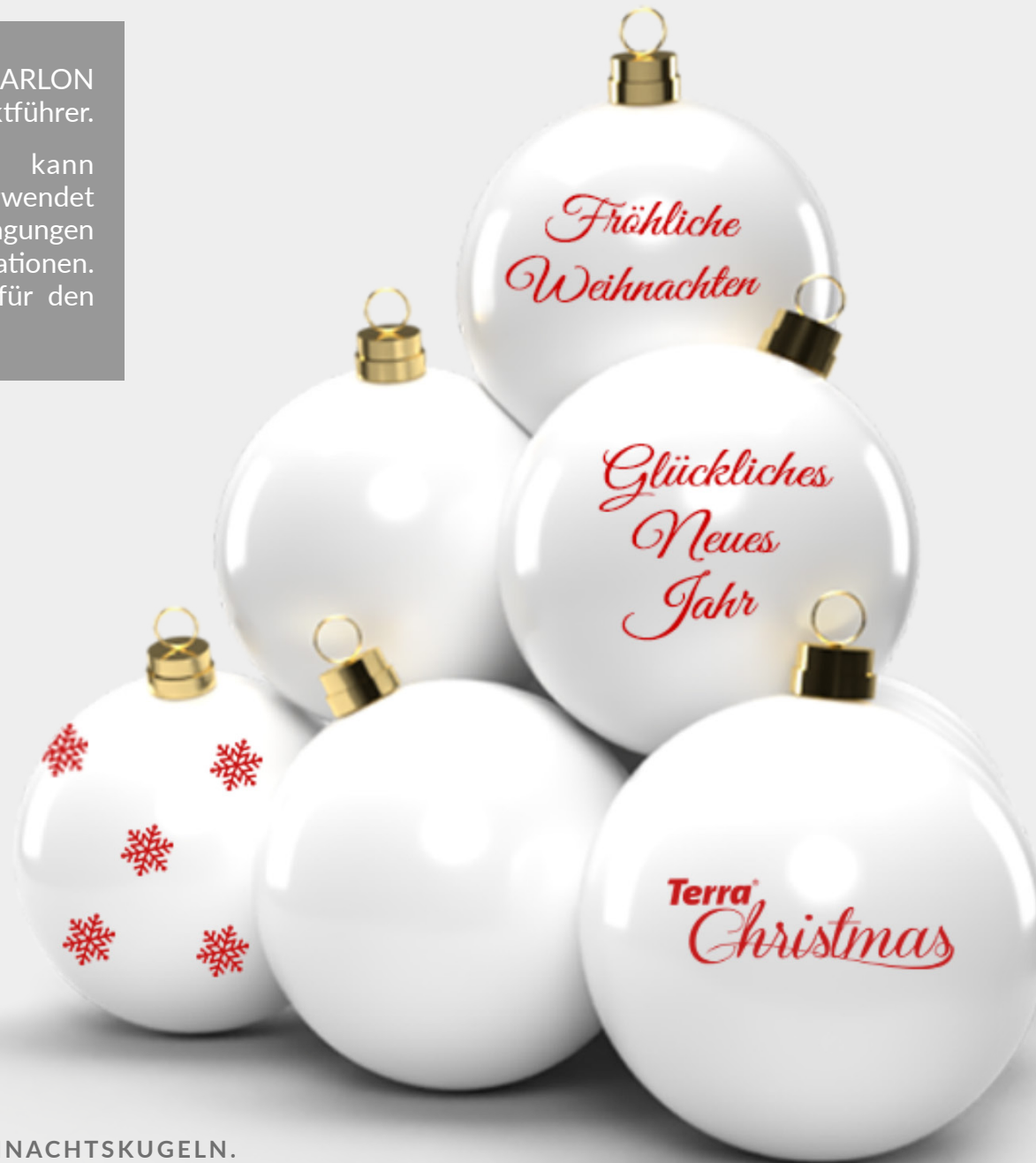
PYRAMIDE X-MAS BALL AUS 10 WEIHNACHTSKUGELN. 4 WEIHNACHTSKUGELN MIT AUFKLEBERN AUS ROTER FOLIE.

Die qualitativ hochwertige Folie kann jahrelang ohne Qualitätseinbußen verwendet werden, unabhängig von Lagerbedingungen oder vom Aufstellungsort der Dekorationen. Sie ist wetterfest und dadurch auch für den schneereichen Winter perfekt geeignet.