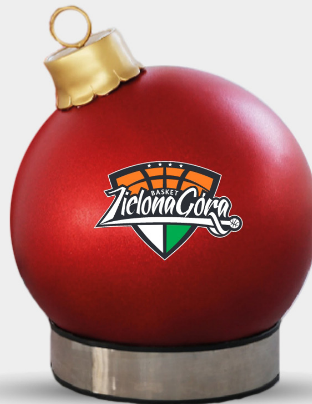
WEIHNACHTSKUGELN MIT LOGO + LAMINAT

Optional können Sie auch die Weihnachtskugeln lackieren lassen und so ihre Oberfläche vor kleineren Beschädigungen schützen.