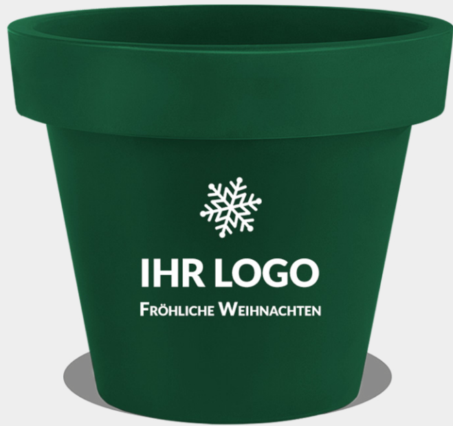
BLUMENTOPF GIANTO MIT LOGO